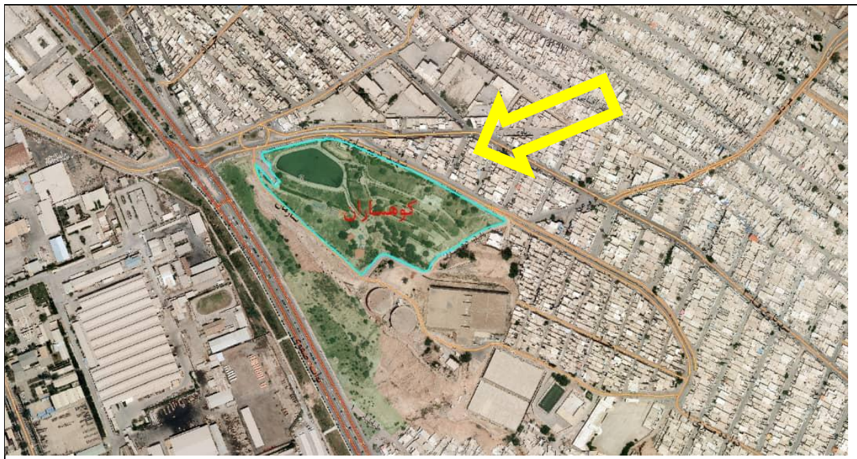
۷- مساحت ملک: کل حدوداً هشت هکتار ( ۸۳,۷۱۷ مترمربع )